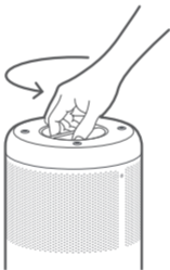
Odstránenie starého filtra

Otočte čistič hore dnom a otočte filter proti smeru hodinových ručičiek, aby ste ho vybrali.