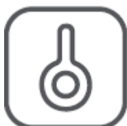
Ochrana proti prehriatiu