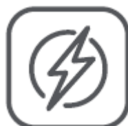
Max. 3680 W