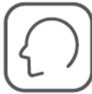
Pamäť pri výpadku siete