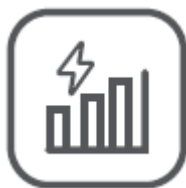
Štatistiky o elektrickej energii