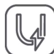
Ochrana proti preťaženiu